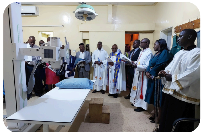
Het digitaal röntgenapparaat